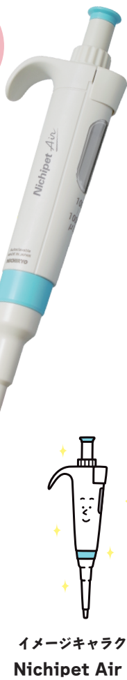
イメージキャラクター Nichipet Air くん