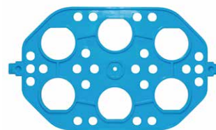
50mLディスポ遠沈管+0.5mLマイクロチューブ用ホルダー 00-NRT-H500005

付属のシャフトに挿し込んで本体に取り付けます。向きを変えることで、回転または転倒攪拌になりますが、ホルダー間で容器がぶつからないよううまく取り付けてください。