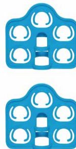
15mLディスポ遠沈管用ホルダー (2個セット) 00-NRT-H100150

付属のシャフトに挿し込んで本体に取り付けます。向きを変えることで、回転または転倒攪拌になりますが、ホルダー間で容器がぶつからないよううまく取り付けてください。