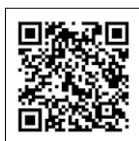
【動きをご覧頂けます】