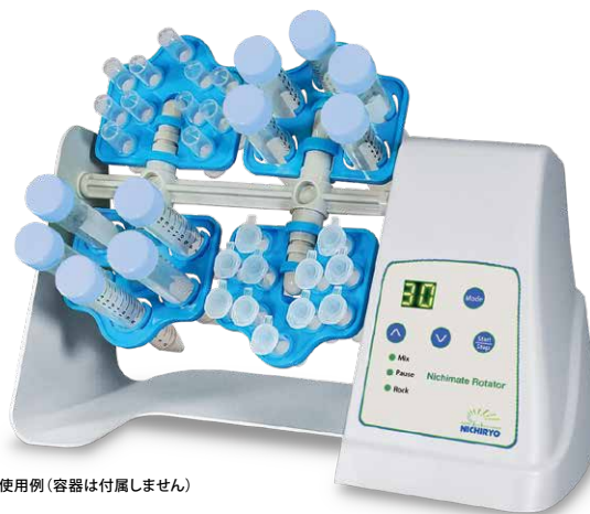
使用例 (容器は付属しません)