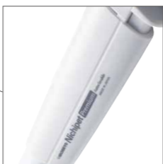
ボディには耐薬性と落下耐久性に優れた材質を採用。