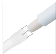
チップ脱着時の摩擦に強い高耐久ノズル採用(2・10・20・100・200・1000μL機種)