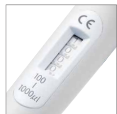
大きなカウンターディスプレイにより容量表示の視認性向上。窓はガラス製。