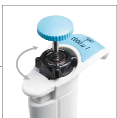
高強度素材と強化設計により、へたりやズレがない容量設定ロック機構を実現。