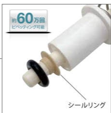
高耐久性シールリング。ノンガラスでメンテナンス容易(2・10・20・100・200μL機種)。