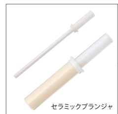
錆びないセラミック製のプランジャを採用し耐薬性向上(100μL以上の機種)。